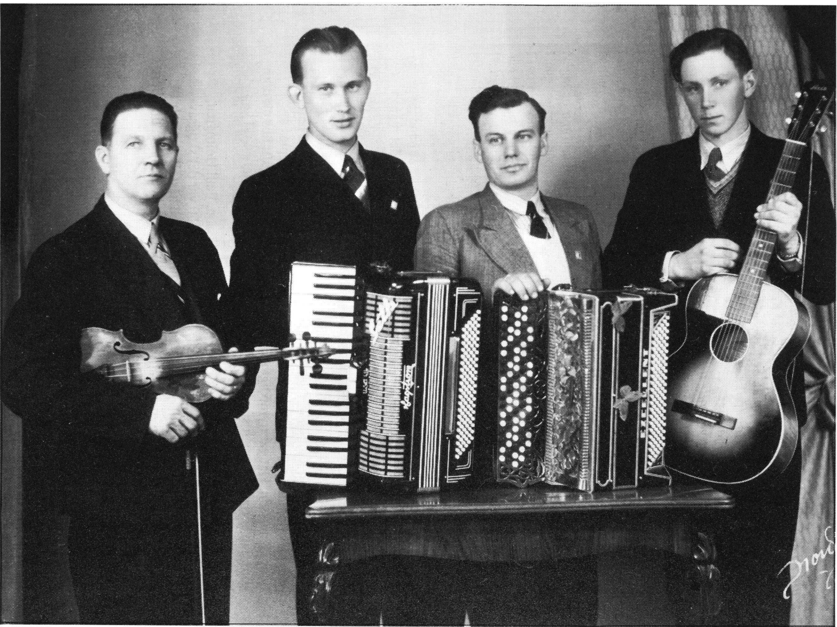
Zeits Kapell 1945.